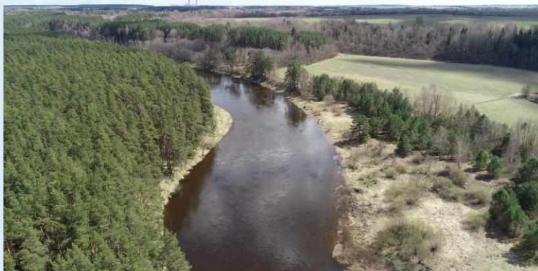
река Виляя вблизи г. Островец

Главная страница / Разделы ГВК / Реестр водных объектов Республики Беларусь