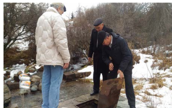
Мешки с химикатами неизвестного состава и токсичности в нескольких метрах от водоприемного колодца

Распределение сельского и городского населения Молдовы по уровню среднего душевого дохода, лей в месяц, 2006 г.